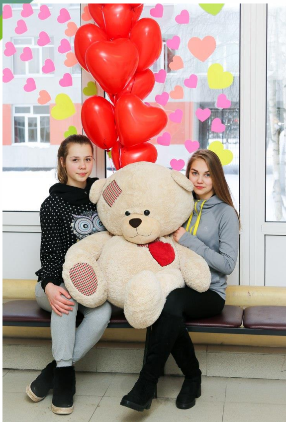
«День всех влюблённых» 2018 год

Оформление выполнено в гардеробе. На окнах наклеены вырезанные из бумаги сердечки, что создаёт романтическую атмосферу. Два атрибута, с которыми можно было фотографироваться в любом положении: большой медведь и связка шариков-сердец. Главными героями композиции были два Амура с коробочкой для валентинок.