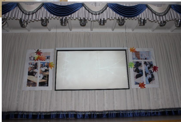
«Школьные окна» 2017 год